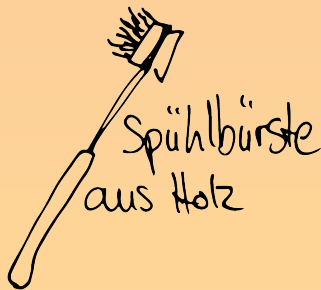
Spülbürste aus Holz